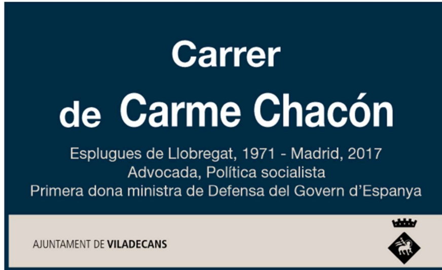
PLACA DE 58,5 x 30,5 cm

A continuació, es mostra un exemple de placa amb la denominació "Carrer de Carme Chacón", així com els esquemes tècnics amb les dimensions i tipografia corresponents.